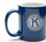
グラフィックとして使用する紋章： まっすぐに表示。傾斜なし。