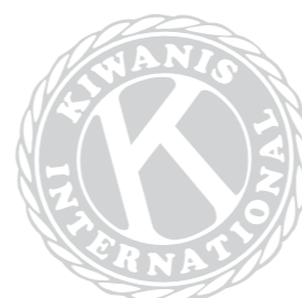
デザインの一部としての紋章： 奨励傾斜角度 左に15°